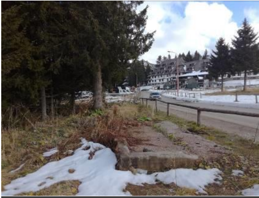
СЛИКА 4: Локација предметног прикључка на постојећи пут