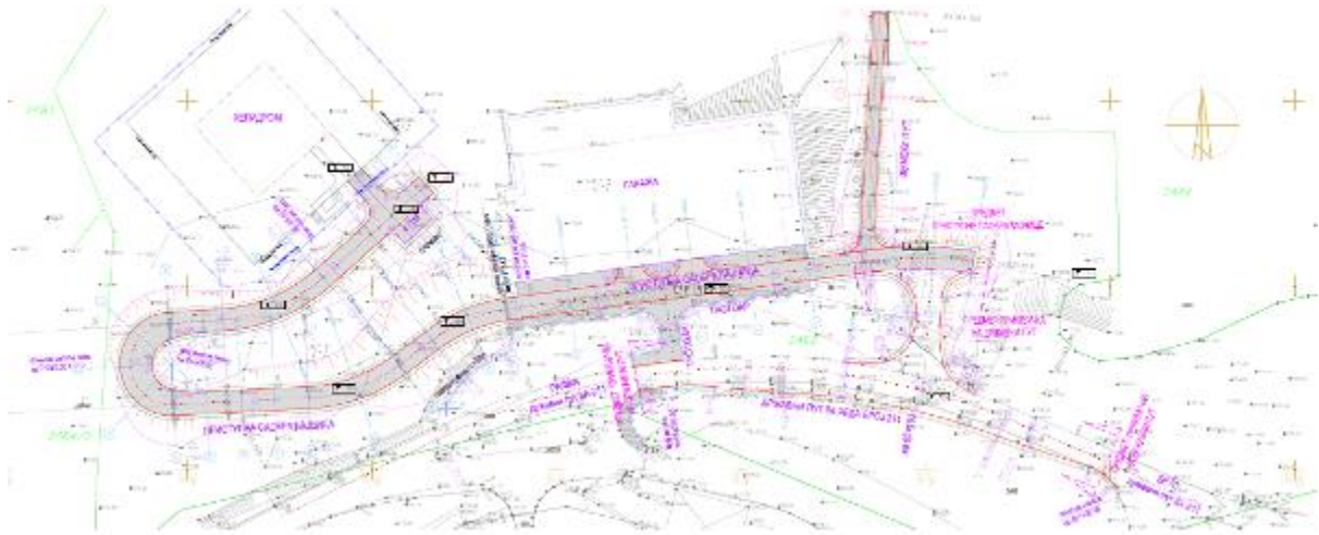
СЛИКА 5: Ситуациони приказ прилазне саобраћајнице-Сепарат 2