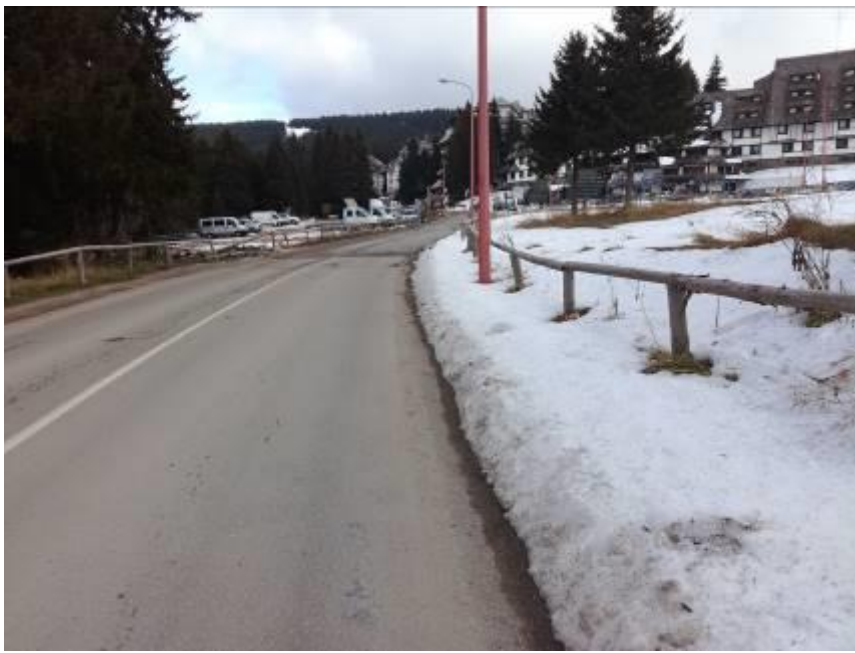
СЛИКА 5: Државни пут у зони планираног прикључка