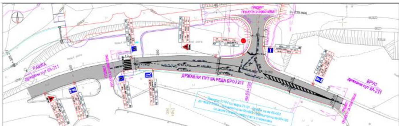
СЛИКА 7: Ситуациони приказ привременог прикључка-Сепарат 1

Имајући у виду ширину коловоза од 6.5m у зони прикључка, пројектом је предвиђено да се на прикључној саобраћајници, одвија двосмеран динамички саобраћај.