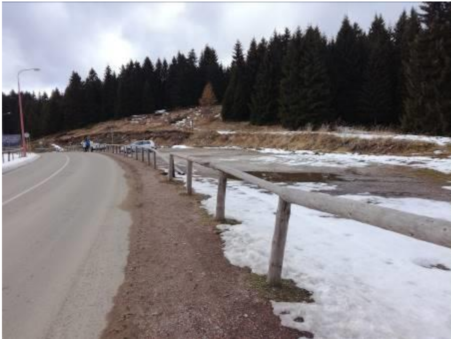
СЛИКА 1: Локација предметног комплекса са десне стране у односу на постојећи пут

На предметној локацији прилазне саобраћајнице тренутно је неуређена површина. Део предметне локације уз државни пут и служи као неуређен паркинг простор, док је остали део локације смештен на стрмој косини обраслој високом и густом вегетацијом.