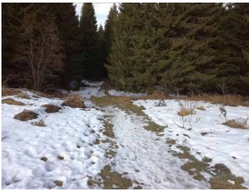
СЛИКА 3: Локација постојећег шумског пута