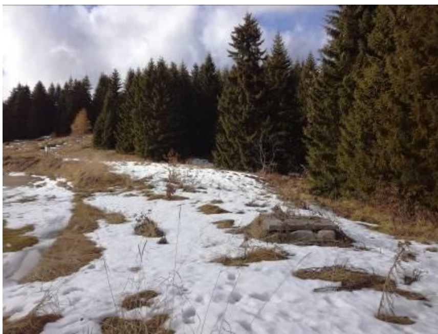
СЛИКА 2: Локација предметног комплекса са положајем постојећег шахта